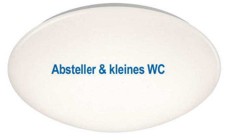
Absteller & kleines WC