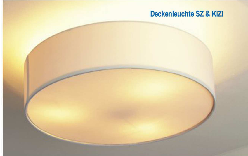
Deckenleuchte SZ & KiZi